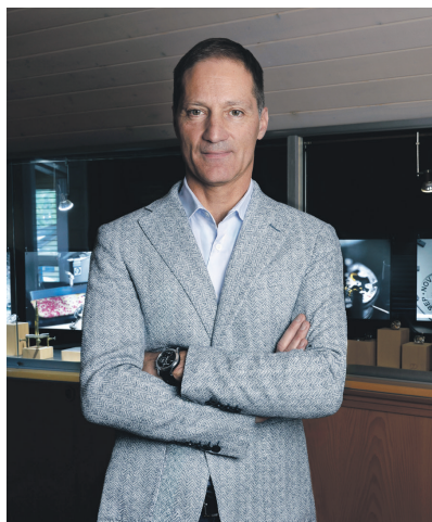
@Zuzanna Adamczewska-Bolle / Dubois Dépraz